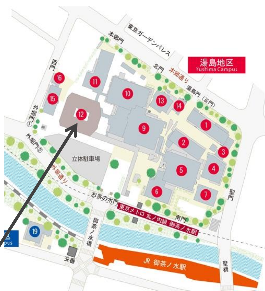
図 12番 M&D タワー <鈴木章夫記念講堂>