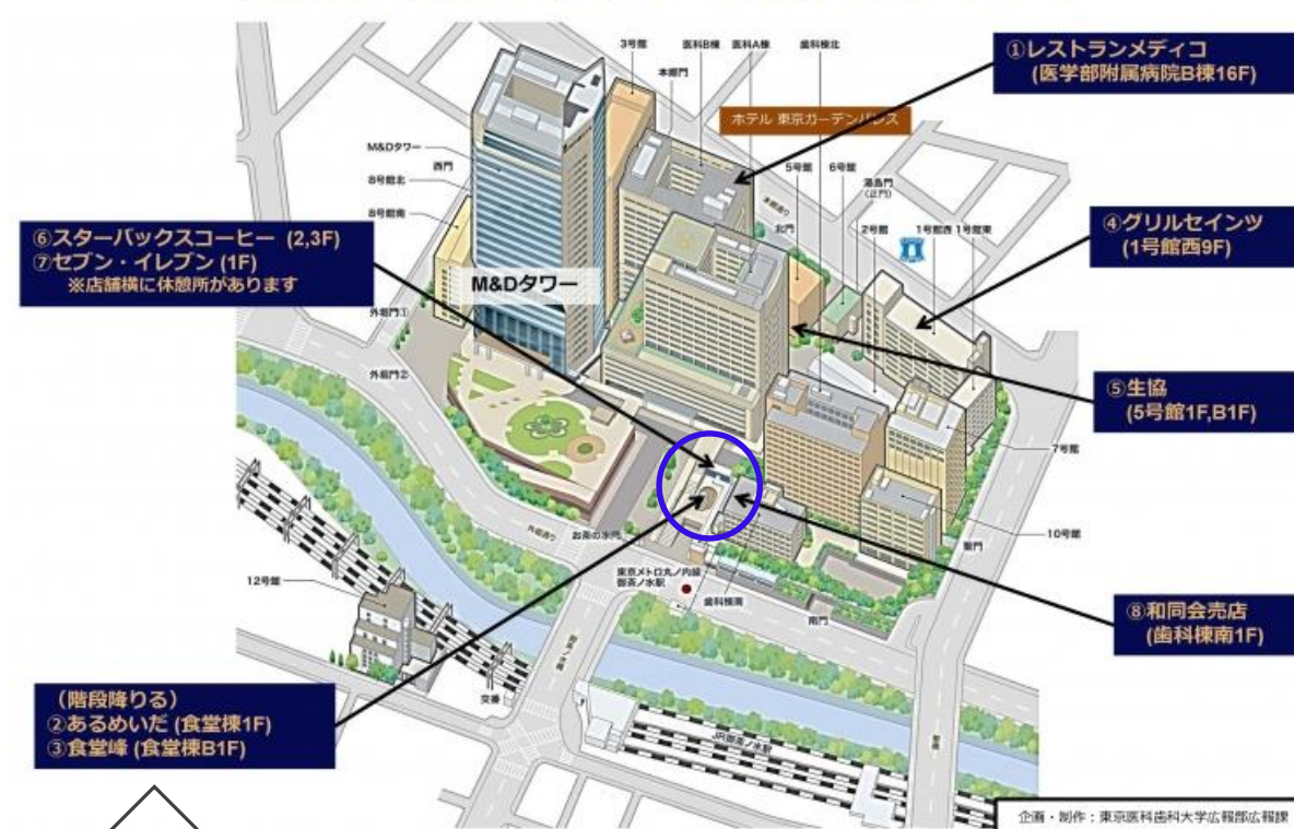
東京医科歯科大学『あるめいた』(食堂棟 1階)